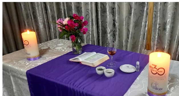
Tuhkakeski viikon messun alttari.

Nuorten kokousviikolla järjestimme heidän toiveestaan tuhkakeski viikon ehtoollismessun, johon liittyi myös tuhkaristillä merkitseminen. Tuhka valmistettiin polttamalla kuivia palmulehtiä. Dove Nest Guest House:n