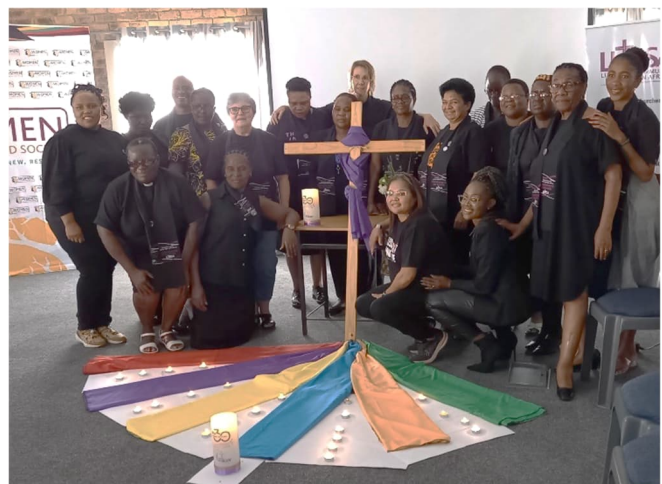
Naistenpäivien osallistujia päätösrukouksen jälkeen.

...oli yleisteemana vuotuisessa naisteologioiden ja -maallikkojohtajien tapaamisessa Emseni-keskuksessa Johannesburgissa 13.-17.3. Osallistujia oli noin kaksikymmentä eri puolilta eteläistä Afrikkaa. Raamattutyöskentelyssä oli pohjana Hagarin kertomus (1. Moos 16). Otsikkona kokouksessa oli kertomuksessa esiintyvän enkelin kysymys Hagarille, ”mistä olet tulossa ja minne olet menossa?”. Naisteologioiden toiminnan historiaa ja sen merkkihenkilöitä halutaan muistaa kokoamalla siitä