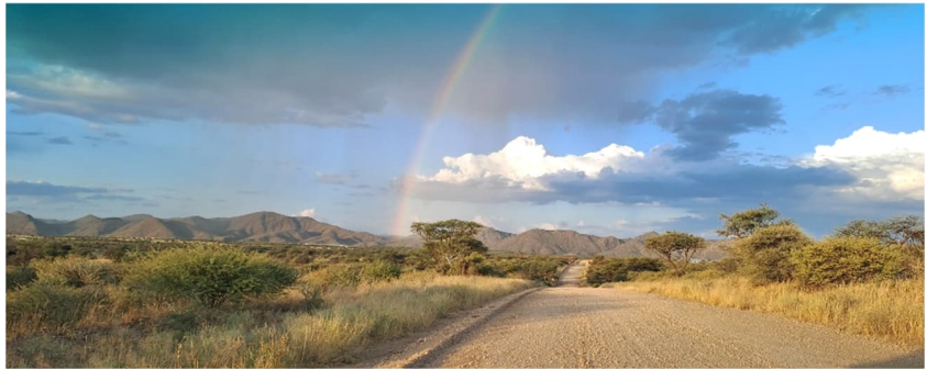
Otjihavera-vuoristoa ja sateenkaari.

Hyvää kevättä, täältä Namibian ”syksystä”. Syksy lainausmerkeissä, koska ei käsite meidän ympäristössämme aivan vastaa niitä mielikuvia, joita se ehkä teissä herättää. Sadekausi on ohi ja ilmat viilenevät. Täällä Windhoekissa, 1700 metrin korkeudessa on sää kuten kauniina alkukesän päivänä