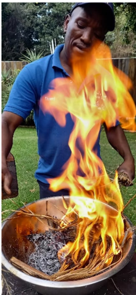
Tuhkaa poltettiin kuivista palmunlehdistä.

Osallistujat saivat opastusta hankesuunnitelman kirjoittamisessa ja tehtäväkseen suunnitelmien laatimisen seuraavaa vuotta varten. Lucsan kautta on haettavissa hanketukea. Tällä kertaa vahvana suosituksena oli käytännön tason yhteistyön vahvistaminen jäsenkirkoissa nuorten ja HIV&AIDS-yhteys henkilöiden kesken.