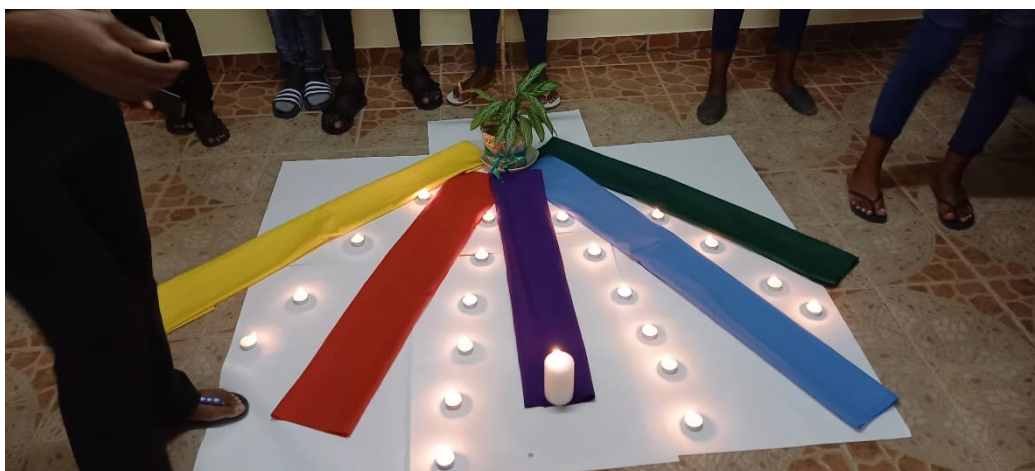
Tämäkin tapaaminen päätettiin yhteiseen rukouslitaniaan.