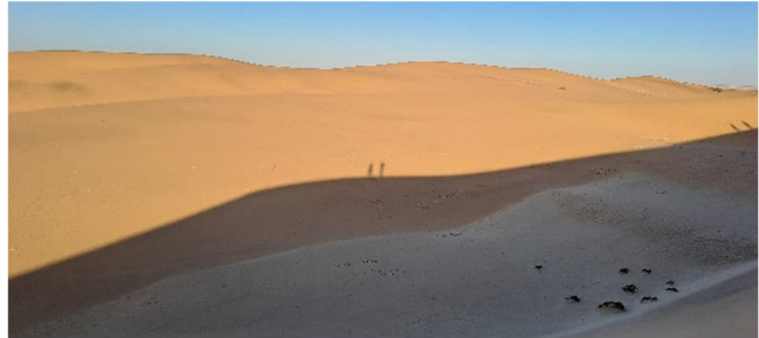
Me dyyneillä.

sakari.loytty@felm.org ja paivi.loytty@felm.org